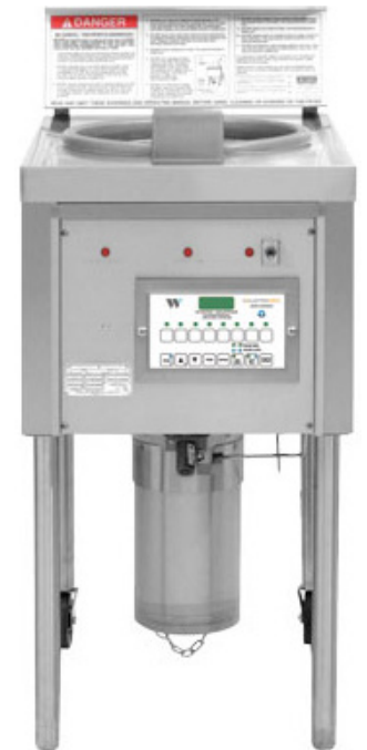
OF49C UND OF59C Collectramatic® Offene Fritteuse Steuerung mit 8 einstellbaren Programmen